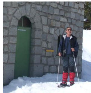
Photo prise le 13 mars 2010 devant la chapelle