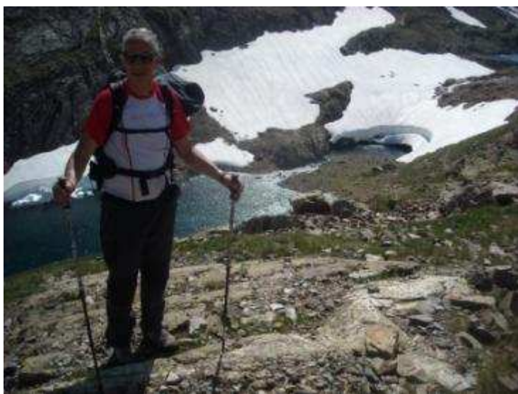
Fotografía durante el descenso del año 2013