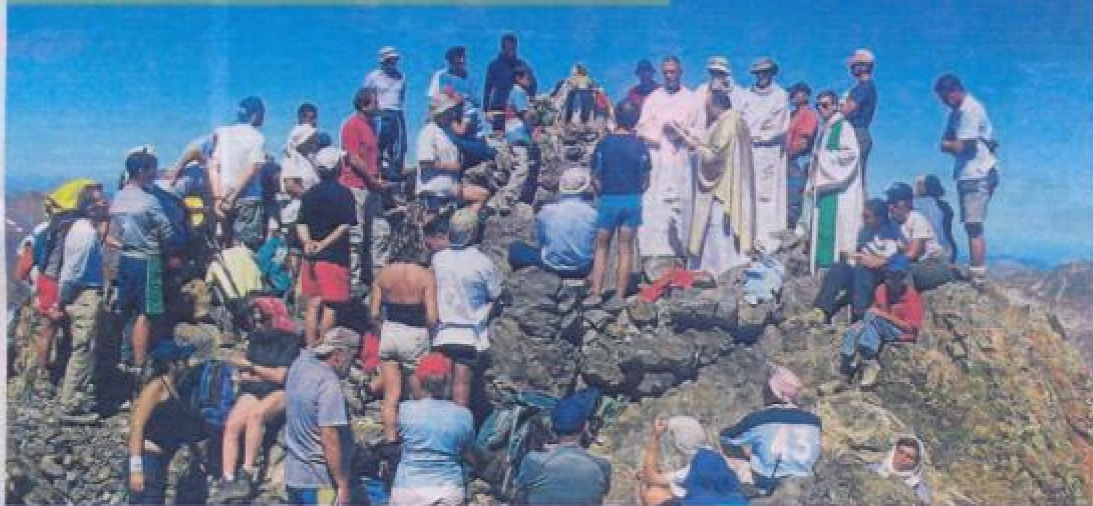
Un momento de la ceremonia religiosa oficiada en la Gran Facha, a la que acuden montañeros franceses y españoles.

T odos los años, el 5 de agosto, tiene lugar una reunión de montañeros españoles y franceses en la Gran Facha, un pico que supera los 3.000 m de altitud, fronterizo de estos dos países. Este peculiar encuentro tiene su origen en un acontecimiento ocurrido en 1948.