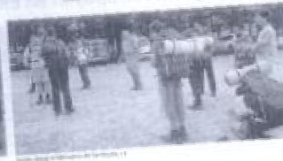
Algunos de los peregrinos que acudieron a la misa en la cima de la Gran Facha.